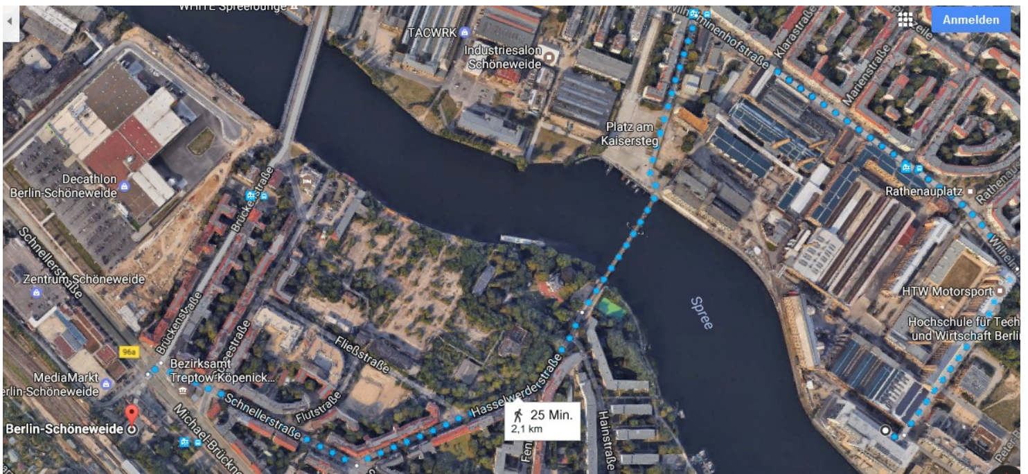
Fußweg vom S-Bahnhof Schöneweide